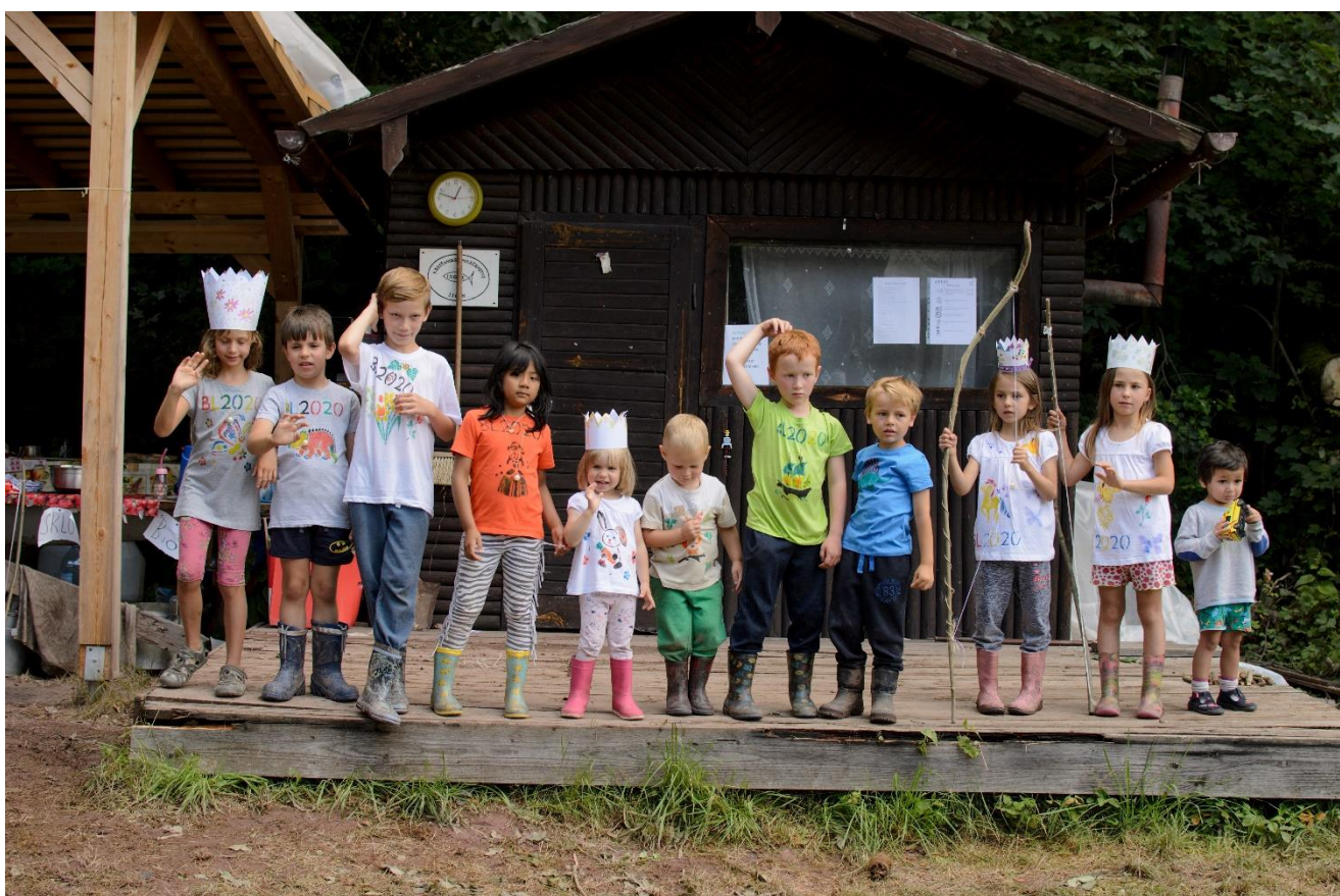
dětský tábor 2020

Poznání činí člověka domýšlivým, ale láska buduje. 1 Kor 8,1