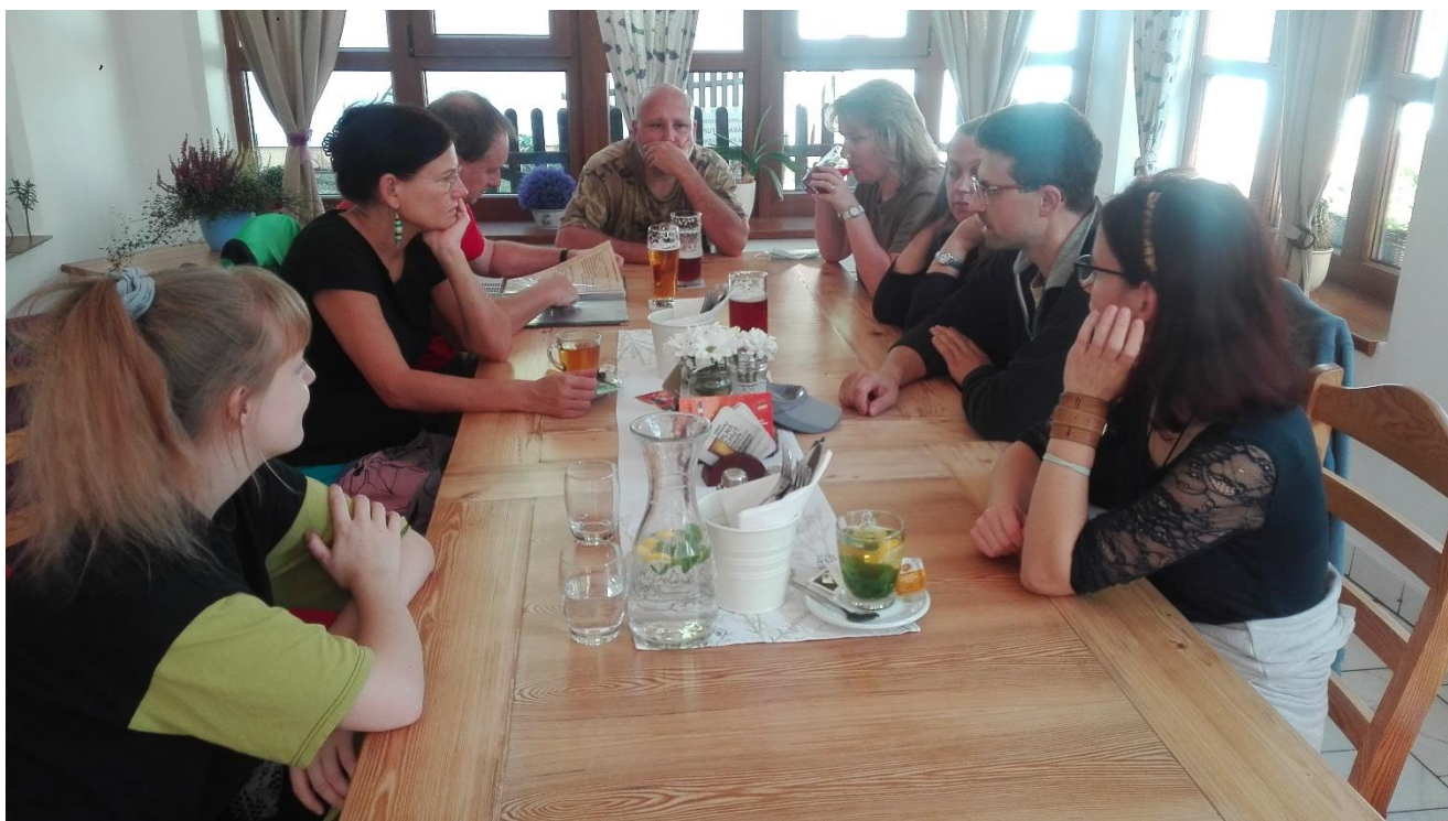
duchovní obnova 2020 – společný oběd

Poznání činí člověka domýšlivým, ale láska buduje. 1 Kor 8,1