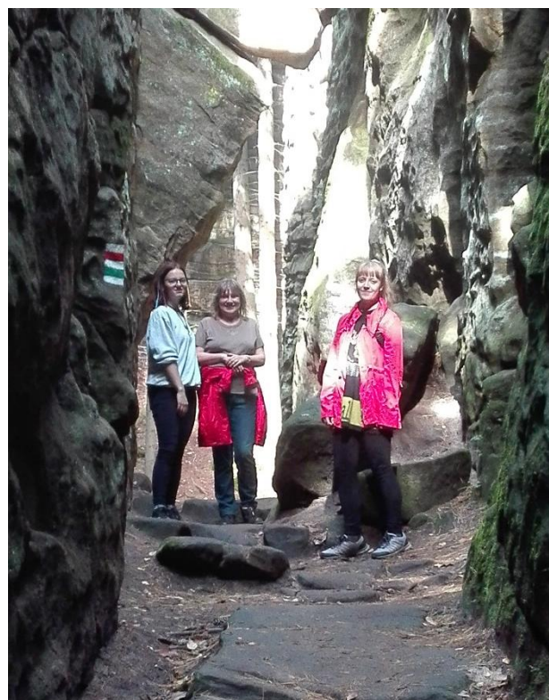
duchovní obnova – procházka skalami